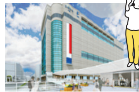
完成イメージバス(広島駅側から当館を臨む)

ペDESTリアンデッキは館内通路経由で猿猴川左岸緑地までつながっており、広島駅~エールエールA館~猿猴川河岸の空間を便利に楽しく歩いていただけるようになります。