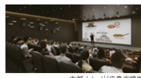
内部イメージ